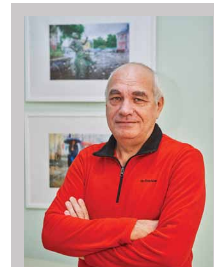
Фотовыставка «Дождливая Самара». Автор экспозиции – заместитель директора и методист ДШИ № 6 Валерий Афанасьев, член Союза фотохудожников России и фотообъединения областного Союза журналистов, руководитель фотошколы по специальности «Художественная фотография», открытой на базе ДШИ № 6 в Крутых Ключах.