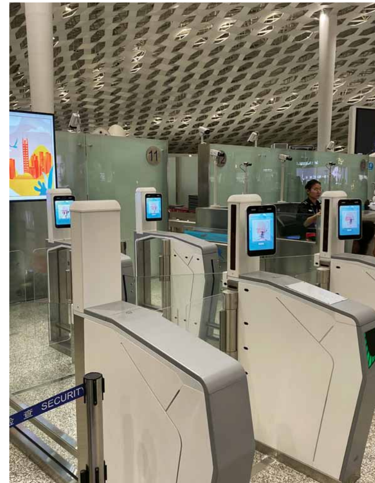
Роботы для паспортного контроля и проверки билетов в аэропорту

Ещё одно последствие технического прогресса – отсутствие живого общения. Китайцы уже давно друг друга воспринимают исключительно через призму социальных сетей. Здесь уже считается странным позвонить человеку или пригласить его куда-нибудь просто так. Если вы окажетесь в китайском кафе, наверняка, заметите, что девяносто девять процентов людей играют в мобильные игры или переписываются, сидя прямо друг напротив друга. И последний недостаток повсеместной компьютеризации – проблемы, возникающие, когда техника выходит из строя. Каждый китаец не понаслышке знает: когда любая большая система даёт сбой и допускает ошибку, работу намного сложнее исправить, чем в случае, если бы ею занимался обычный человек. Так выглядит «сегодняшнее будущее» в Китайской Народной Республике. А какая дорога в будущее ждёт нас? Как говорится, время покажет.