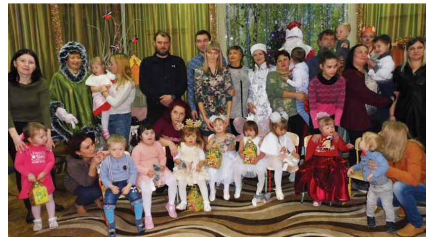
Ёлка для «Самарских солнышек»

А ещё мы как организаторы получили массу позитивных отзывов и благодарностей, воочию увидели положительный эффект от конкурса. Он качественно по-новому объединил семью и сопровождающего педагога, сблизил их. Нашим сотрудникам стало проще контакти-