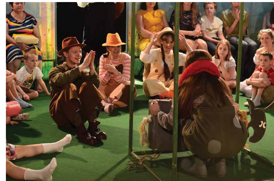
«Счастливого Ганса». Сцена из спектакля в театре СамАрт

В итоге мой выбор пал на Ярославль. Приехал туда зимой 90-го года. Мороз – под минус 30 градусов. Абсолютно тёмный город. А по нему бродят пьяные гегемоны.