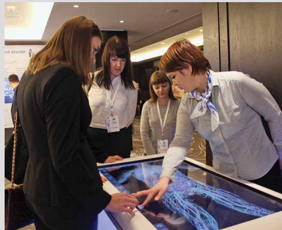
СамГМУ представил на конференции инновационные образовательные и лечебные технологии