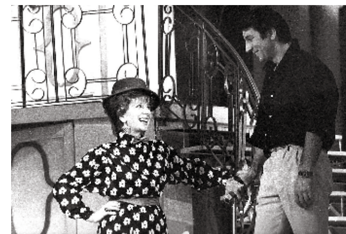
Елизавета Английская в спектакле «Мария Стюарт»