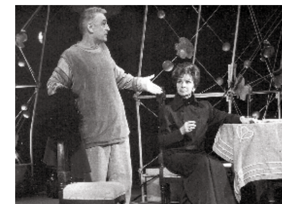
Цвия в спектакле «Сад» 1993