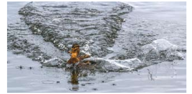
Мягкая посадка