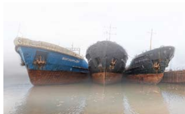
Три богатыря