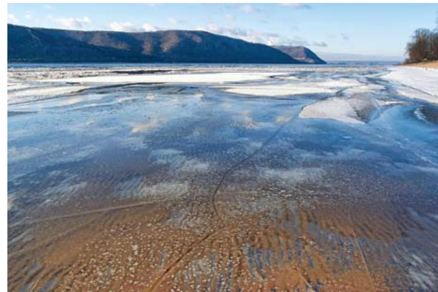
Красноглинский пляж весной