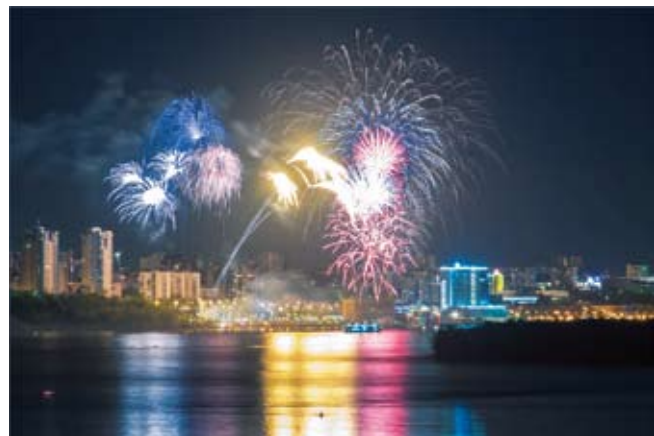
Салют победы