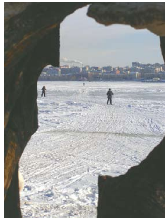
На природу