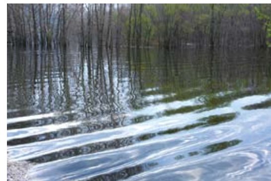
Зимняя прогулка