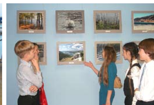
Вид с горы Стрельной