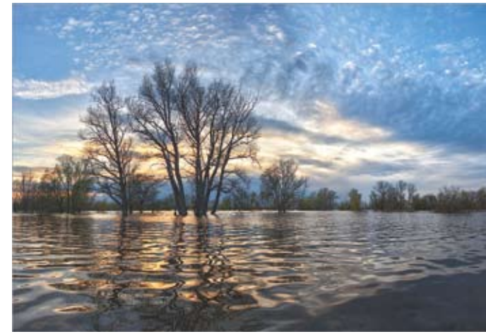
Весенний разлив