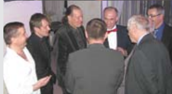
Конкурс «Леди-Ретро» Мужское жюри совещается