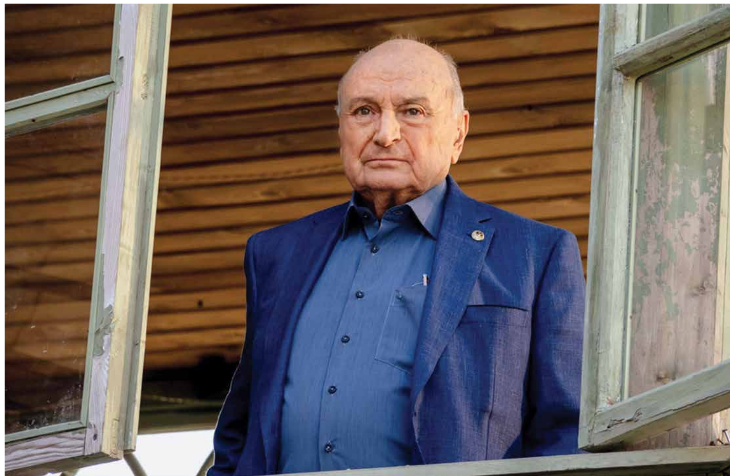
Кадр из фильма «Одесский пароход»

Он и остроумный бытовой наблюдатель, и гениальный рассказчик, и блистательный социальный сатирик. Но уже при жизни – ВЕЛИКИЙ писатель: тонкий, вдумчивый и пронзительный... Его не стало ровно два года назад – 6 ноября 2020 года. Ему исполнилось 86 лет. Несомненно, он сумел сделать наш мир гораздо лучше и добрее. Он был мудр и оптимистичен – этот знаменитый одессит с потёртым коричневым портфелем, ставший общепризнанным олицетворением интеллектуального юмора. Но его шедевры – нечто большее, чем просто юмор. Как правило, это философские размышления о жизни, о времени и о нас с вами.