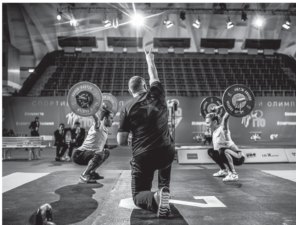
• Самарская областная организация Союза журналистов России благодарит за оказанную поддержку партнёров мероприятия: галерею «Новое пространство», Национальный парк «Самарская Лука», Кондитерское объединение «Россия», Самарское областное отделение Союза фотохудожников России, аппарат Уполномоченного по правам человека в Самарской области.