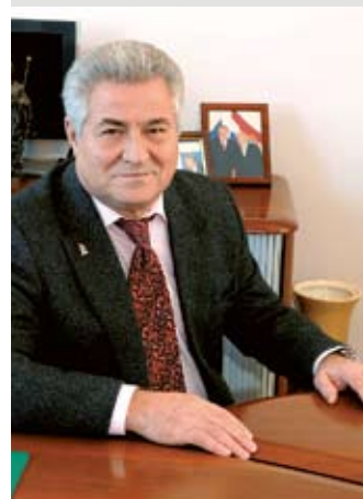
Геннадий КОТЕЛЬНИКОВ ректор СамГМУ, академик РАН

• Наша компания основана в 1999 году. Мы производим и продаём свою продукцию в более чем 60 странах мира, в том числе в США и Японии. Также сотрудничаем со многими компаниями и институтами в Москве. Наши устройства применяются в целях реабилитации пациентов после инсультов. Эта конференция – показатель того, что технологии создания нейроинтерфейсов развиваются и в России.