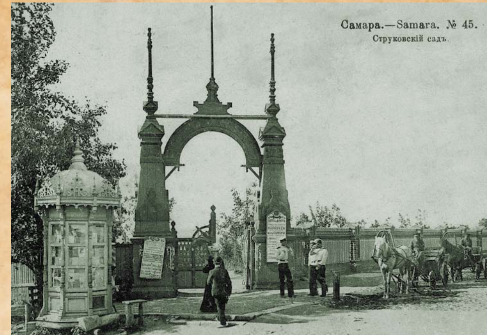
Самара.—Samara. № 45. Струковей садъ.

Кажется, нет такой сферы жизни города и губернии, где бы губернатор не оставил свой яркий след. При его содействии в губернском центре началось устройство тротуаров, были установлены первые сто фонарей для освещения улиц, приведены в порядок спуски к Волге и Самаре, налажено регулярное почтовое сообщение. Грот выступил инициатором сооружения самарского водопровода, способствовал передаче город-