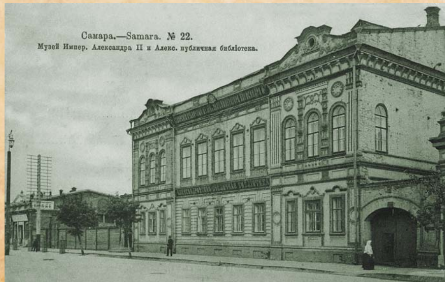
Самара.—Samara. № 22. Музей Импер. Александра II и Алекс. публичная библиотека.