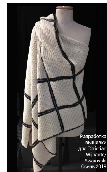
Разработка вышивки для Christian Wijnants/ Swarovski Осень 2019