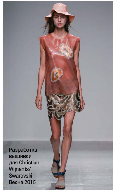
Разработка вышивки для Christian Wijnants/ Swarovski Весна 2015