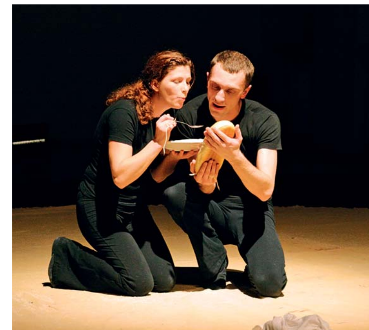
PALIMPESTON, или Одно вращение спектакля вокруг своей оси