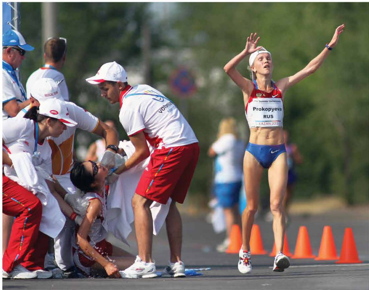
Полный финиш На летней универсиаде в Казани в 2013 году спортсменки отдавали все силы за победу. Накал борьбы временами не уступал олимпийскому