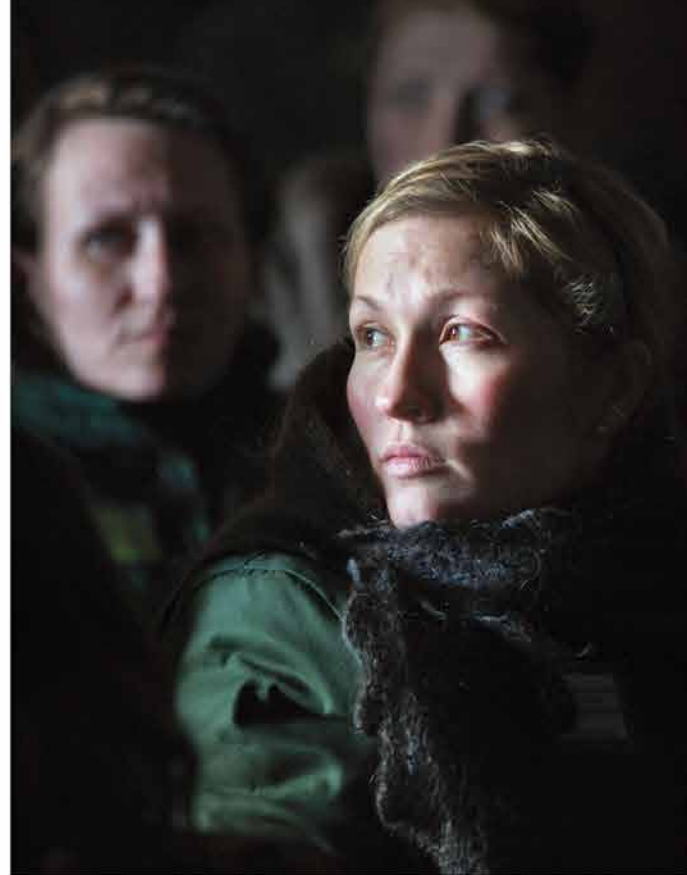
Надежда Женщины везде остаются женщинами. В женской колонии тоже