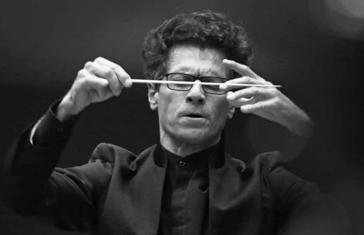
Параллели Французский дирижёр Николя Краузе на сцене Самарской филармонии