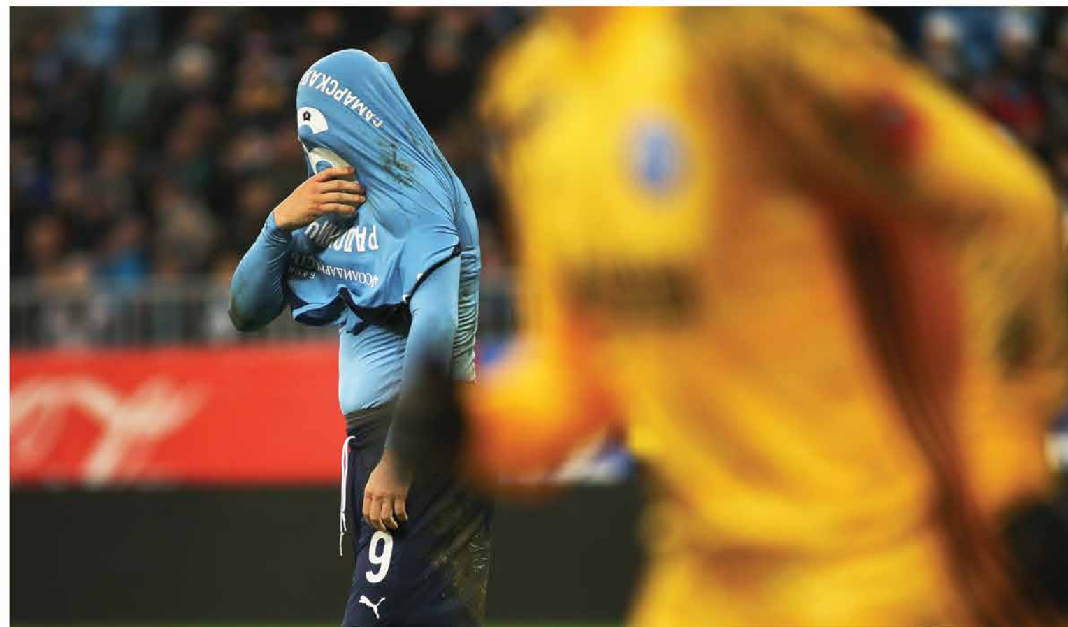
Угадай, как нас зовут? Футбол и футболисты выглядят по-разному. Иногда вот так