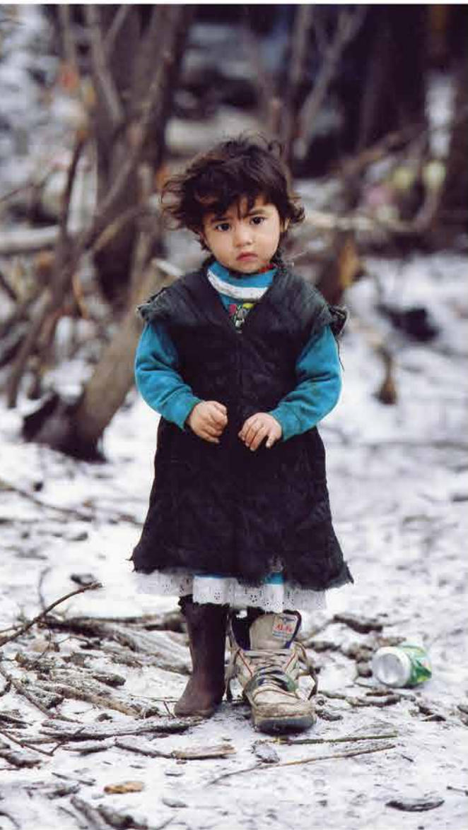
Детство Удивительная девочка из числа среднеазиатских цыган, остановившихся на время в Самарской области. Красавица с печальными глазами в одной огромной кроссовке. Такое вот детство