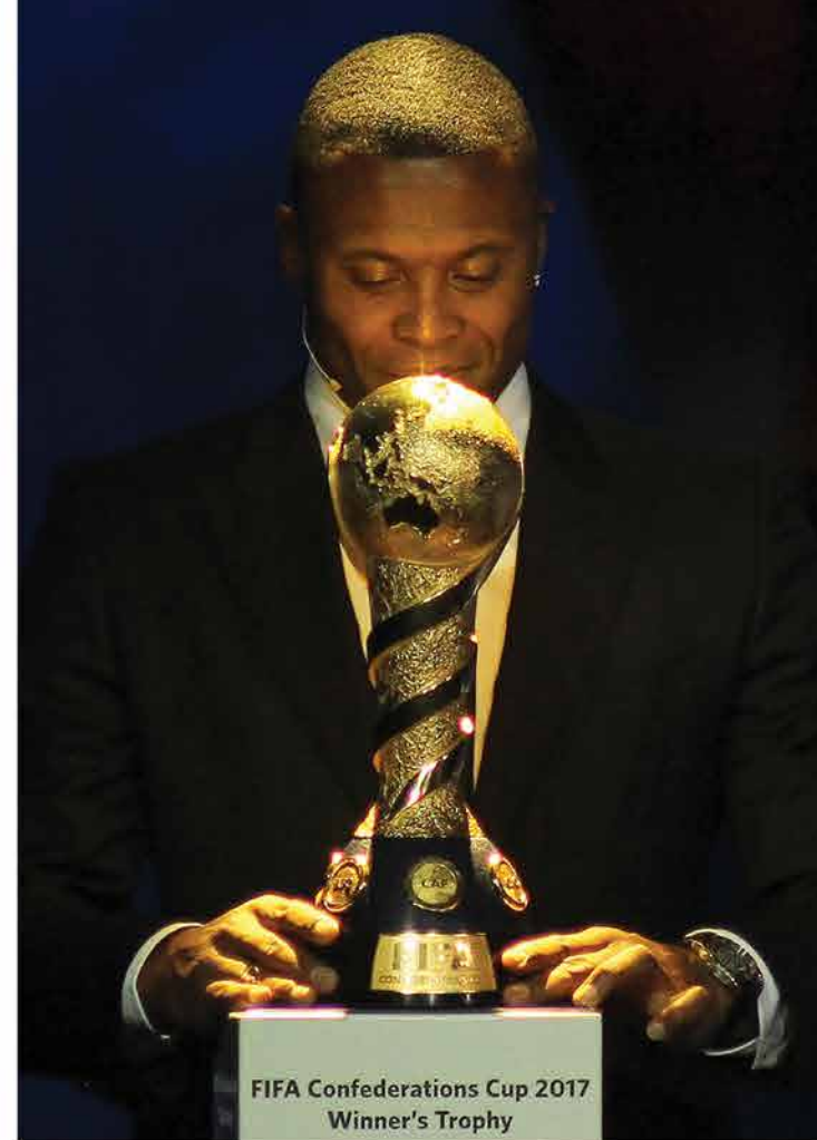
Блик Бразильский футболист Жулио Баптиста с Кубком Конфедераций во время жеребьевки этого турнира в Казани