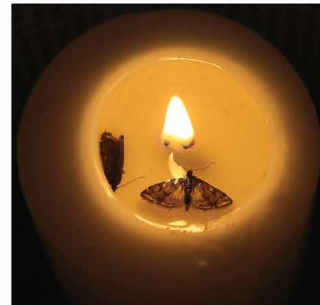
Жизнь за огонь Ночные бабочки- мотыльки неукротимо летят на огонь