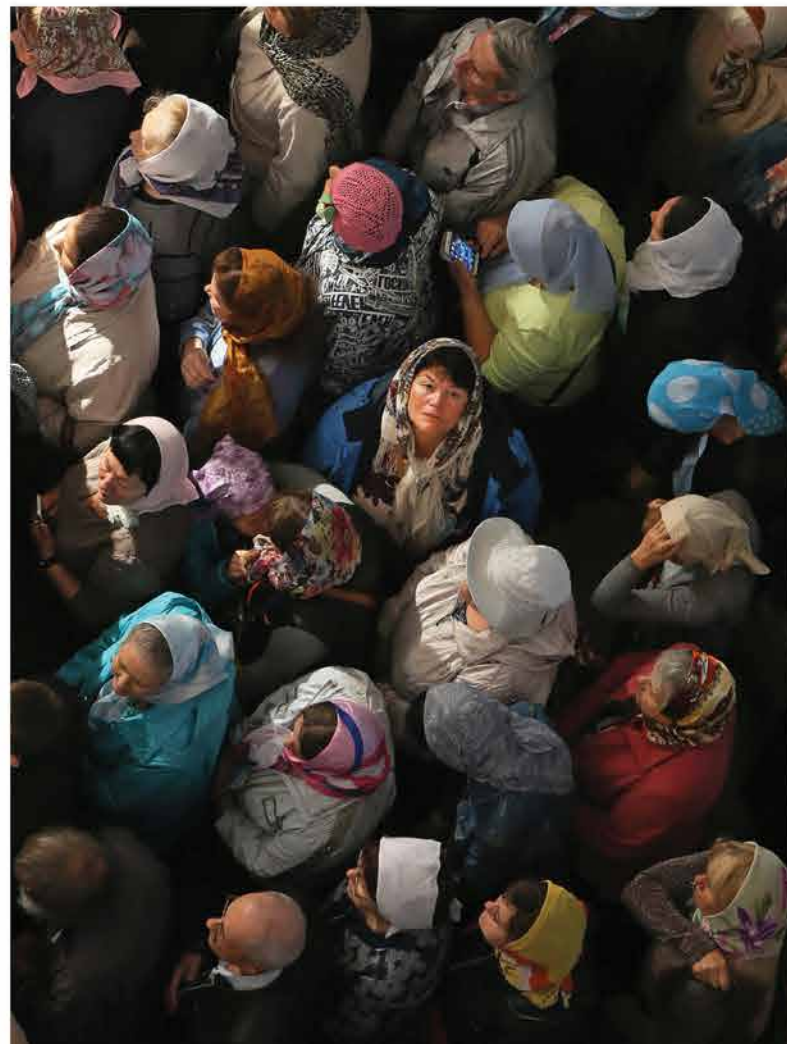
Одна Одиноким можно быть и в толпе во время молитвы. Женщина обратила свой взор под купол Софийского собора в Самаре