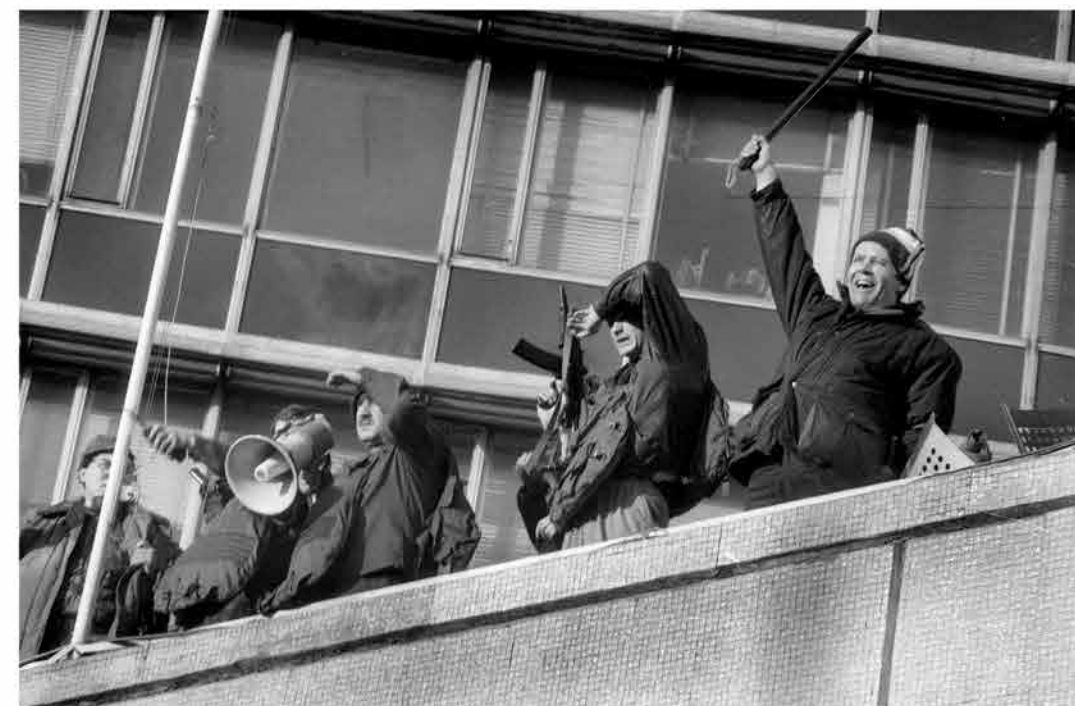
«Больше не будет ни мэров, ни прочих...» 3 октября 1993 года в Москве выдался горячим. Очередной переломный момент российской истории. Вооружённые люди во главе с отставным генералом Альбертом Макашовым (в центре с мегафоном) на балконе захваченной московской мэрии