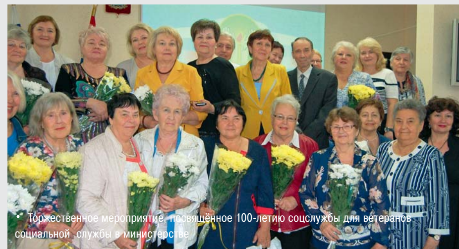
• Торжественное мероприятие, посвящённое 100-летию соцслужбы для ветеранов социальной службы в министерстве

В этом году профессиональный праздник у социальных работников – особенный, потому что отмечается в год 100-летия создания социальной службы Самарской области. Работники нашей отрасли получили заслуженные награды, в их адрес звучали слова признательности и благодарности за такой нелёгкий труд, за чуткость к людям. Это не только приятно, но и ко многому обязывает. Ведь и предыдущие поколения соцработников – какие бы должности они ни занимали – каждый на своём рабочем месте разделяли чужую боль, конкретными делами утверждали идеалы добра и справедливости. Мы помним и стараемся соответствовать. Вот она – такая далёкая, но такая ещё близкая история. И дни сегодняшние.