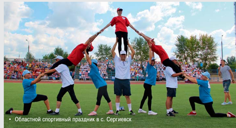
• Областной спортивный праздник в с. Сергиевск

В конкурсы профмастерства активно включаются инспекторы по назначению выплат, социальные работники, уполномоченные по охране труда. Несомненно, подобные состязания пробуждают здоровые амбиции, заставляют работать над собой. И чем выше уровень специалистов, тем более качественные услуги будут получать подопечные – пенсионеры, инвалиды, малоимущие, семьи с детьми. Проявить себя в профсоюзе может каждый. Например, через Ассоциацию ветеранов, вобравшую в себя людей опытных и знающих. А строить карьеру, воспитывать в себе лидерские качества можно в Ассоциации молодёжи. Почувствовать свою принадлежность к большой важной отрасли помогает музей истории социальной службы Самарской области. Это – не застывшая структура, а живой организм, неотделимый от дня сегодняшнего. Отрадно, что профсоюз даёт возможность реализовать и творческий потенциал. Например, участвуя в молодёжных конкурсах – литературном и на лучший видеоролик. Блеснули талантами соцработники Сызрани, Октябрьска, Шигон – провели флешмоб. В ритмичном танце каждый почувствовал себя частью коллектива, который делает общее важное дело. Ярким и незабываемым стал заключительный этап спартакиады социальных работников и социальных педагогов «Спорт и Волга – здоровье надолго». Победила команда Юго-Западного округа. Но главным, пожалуй, стал