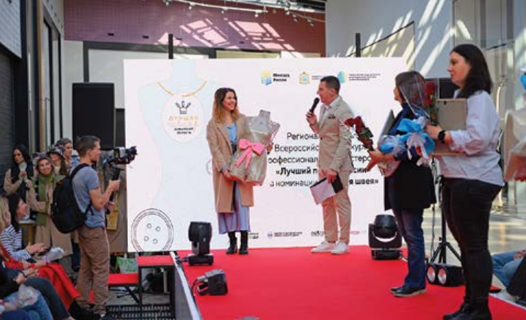
Специальный приз за 4 место от партнёра конкурса – фирмы «Иминера»