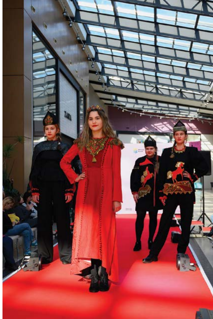
Модели театра моды «Акцент»