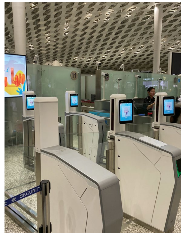
Роботы для паспортного контроля и проверки билетов в аэропорту

Ещё одно последствие технического прогресса – отсутствие живого общения. Китайцы уже давно друг друга воспринимают исключительно через призму социальных сетей. Здесь уже считается странным позвонить человеку или пригласить его куда-нибудь просто так. Если вы окажетесь в китайском кафе, наверняка, заметите, что девяносто девять процентов людей играют в мобильные игры или переписываются, сидя прямо друг напротив друга. И последний недостаток повсеместной компьютеризации – проблемы, возникающие, когда техника выходит из строя. Каждый китаец не понаслышке знает: когда любая большая система даёт сбой и допускает ошибку, работу намного сложнее исправить, чем в случае, если бы ею занимался обычный человек. Так выглядит «сегодняшнее будущее» в Китайской Народной Республике. А какая дорога в будущее ждёт нас? Как говорится, время покажет.