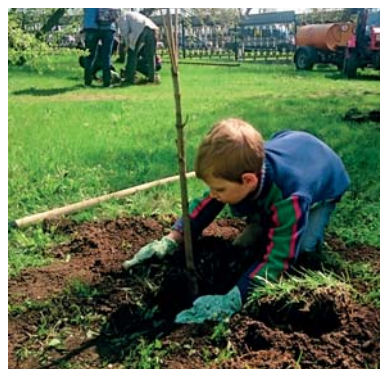
Вкладываем всю душу