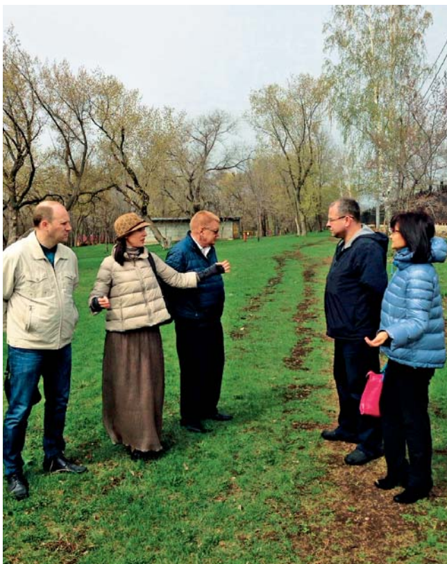
Выбираем место посадки будущей аллеи

Надо отметить, что организаторы очень серьёзно подошли как к самому процессу высадки деревьев, так и к их будущему. Саженцы прошли специальную проверку и подготовку в питомниках ГБУ СО «Самаралес». Совместно со специалистами-экологами и работниками парка был в деталях проработан план посадки. С помощью специальной техники были подготовлены лунки, закуплен плодородный грунт. Кроме этого Загородный парк взял на себя ответственность за последующий уход за деревьями и их полив.