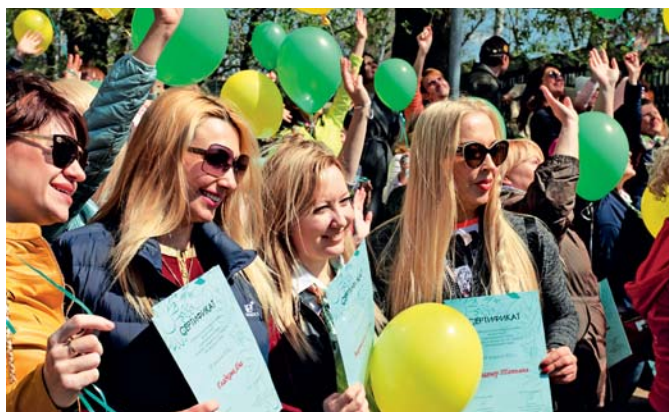
Сертификаты почётного участника закладки Аллеи Мира вручены