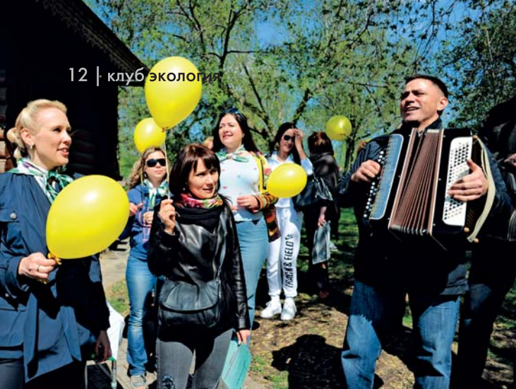
День Победы. В преддверии главного праздника