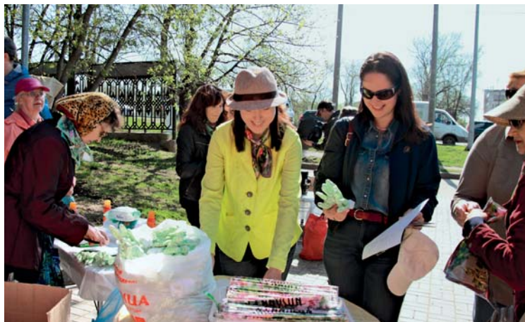
Регистрация участников. У прекрасных леди всё должно быть прекрасно: и перчатки для работы, и платочки для настроения.