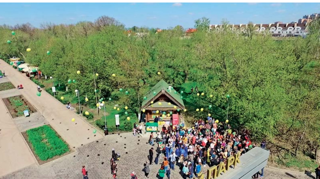
Салют из шариков в честь закладки Аллеи Мира