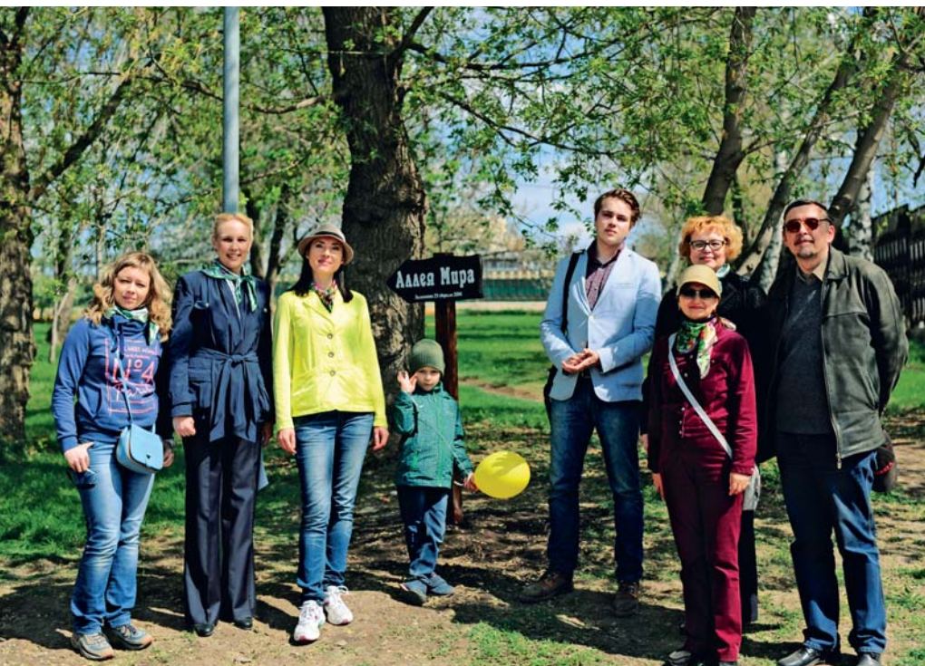
Организаторы акции и юный эколог-энтузиаст. Аллея Мира заложена!