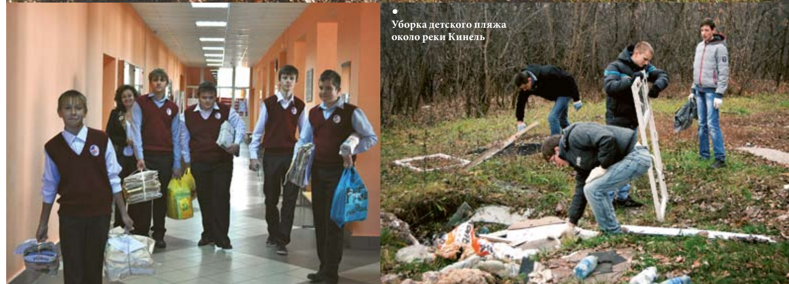
• Уборка детского пляжа около реки Кинель