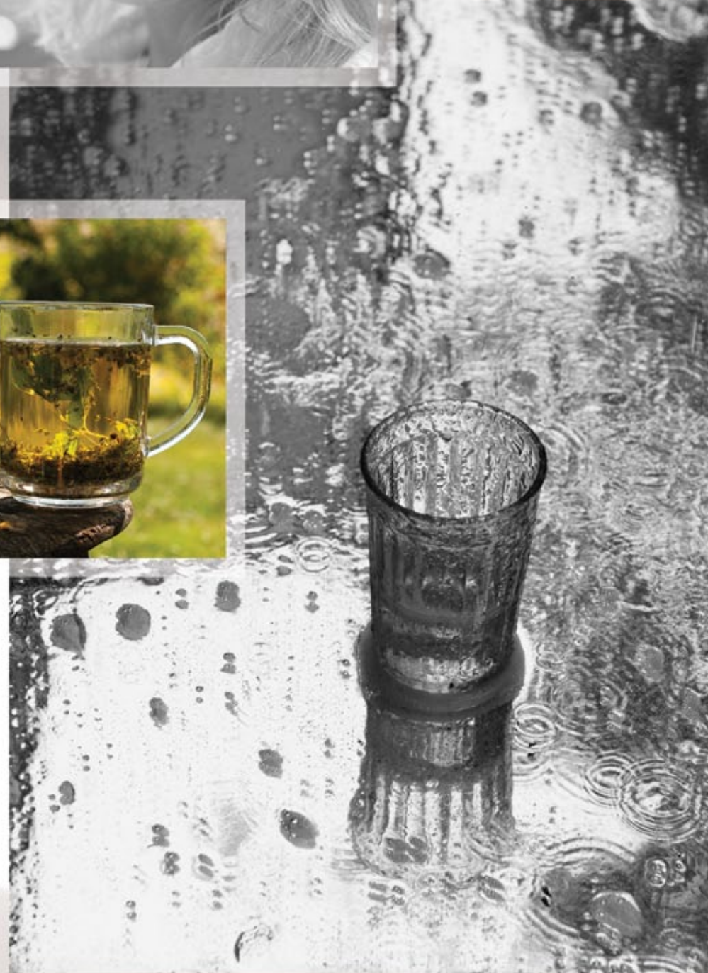
Тост за Анри Картье-Брессона