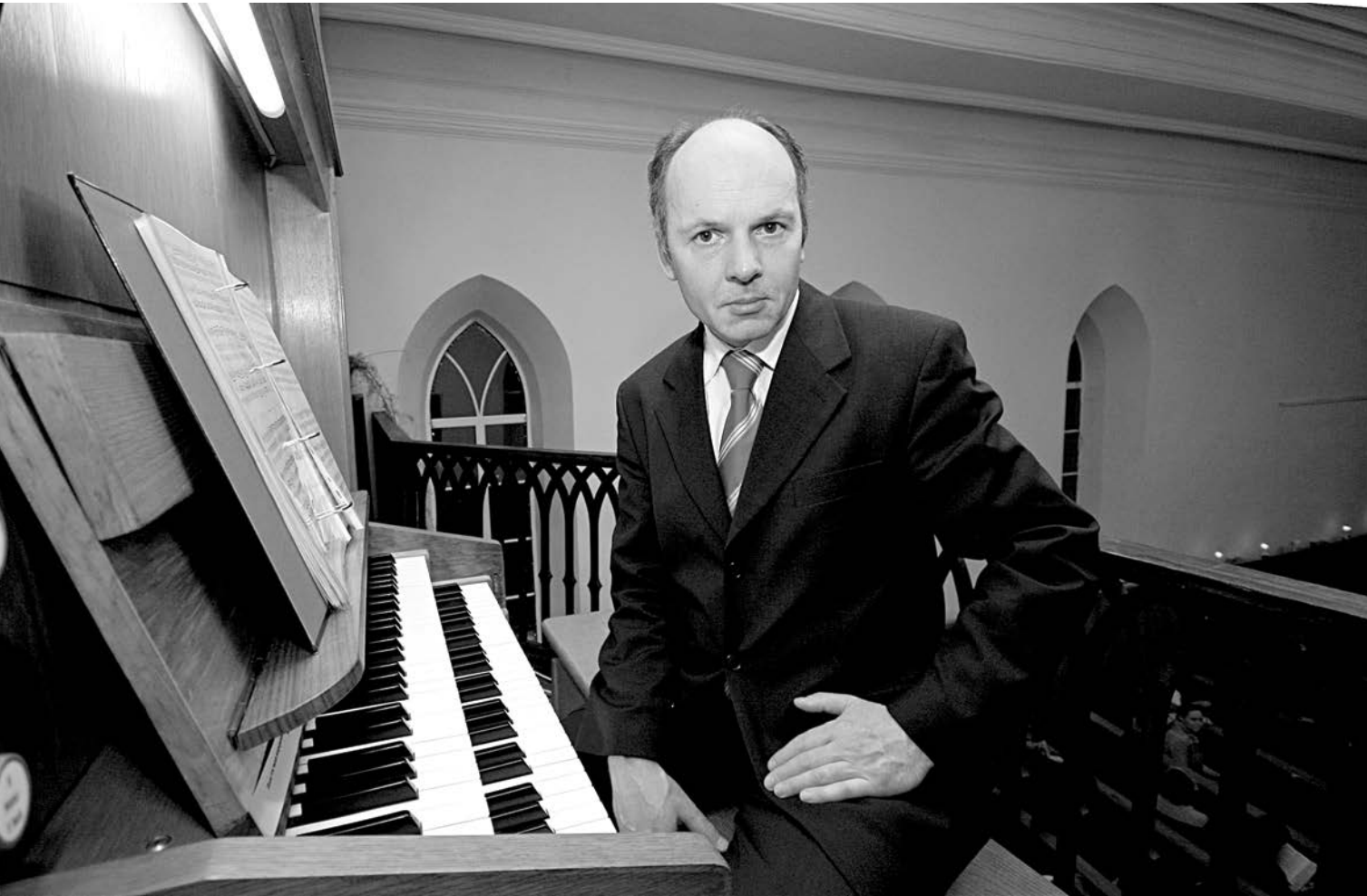
Немецкий органист в самарской кирхе