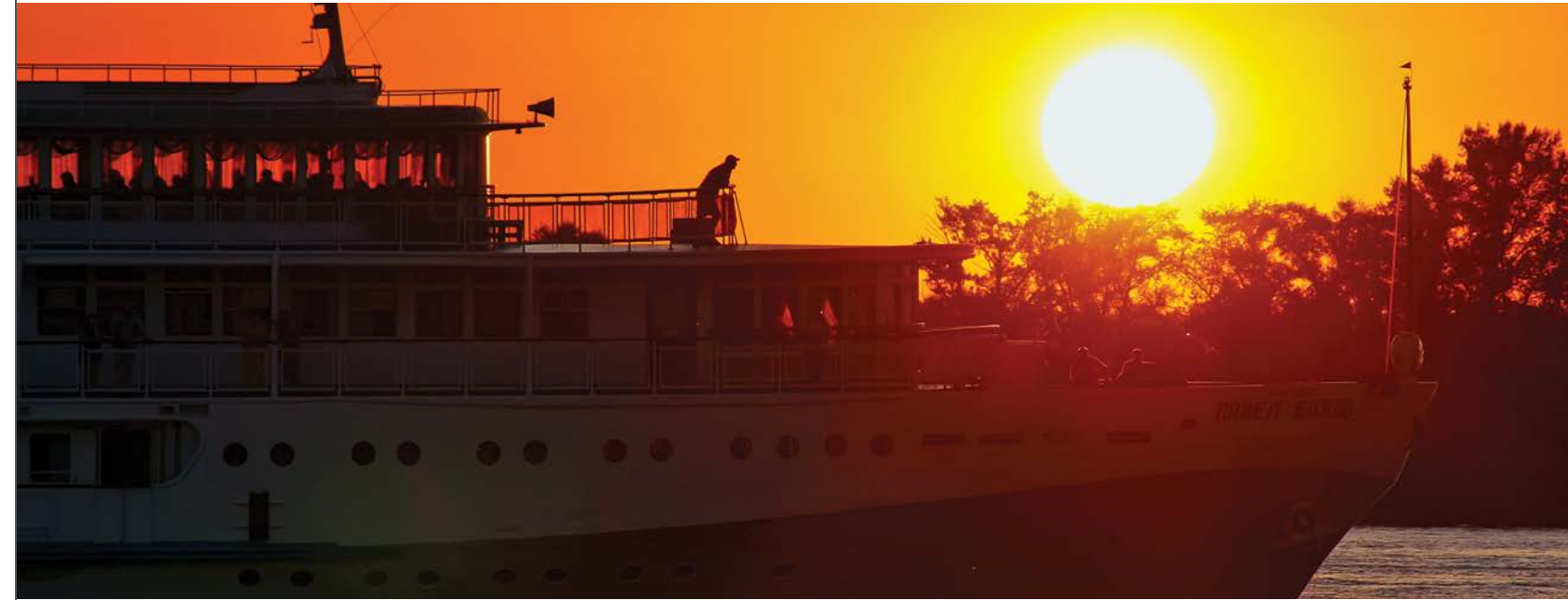
Вплываю в закат

ой учитель фотографии не учил что снимать. Это было полнейшей свободой. Мне нравится снимать всё. Но самое интересное для меня – репортажная съёмка и стрит-фото. Спустя много лет и после миллиона неудачных снимков появилось ощущение чуда и магии фотографии. Как у художников, которые говорят, что их рукой управляет божественное, так и у фотографа пальцем на спусковой кнопке фотоаппарата управляет нечто божественное.