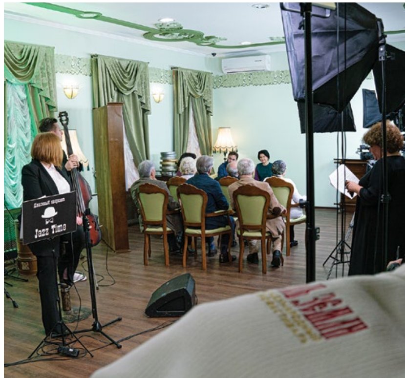
Онлайн-студия фестиваля «Соль земли»