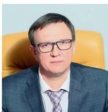
Бугаков Александр Владимирович, глава г.о. Отрадный