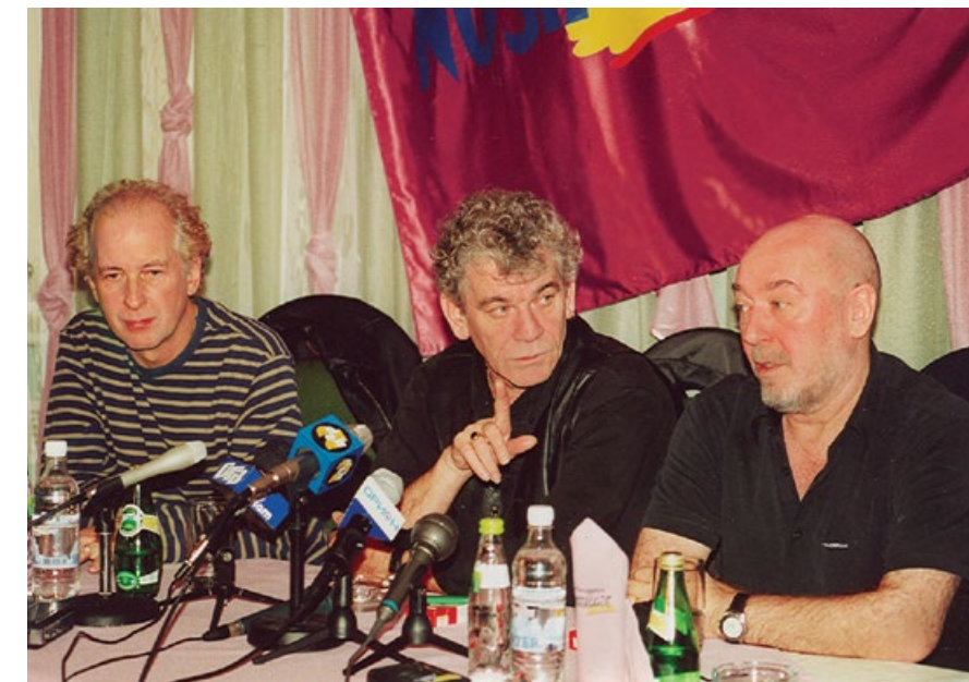
Ронни Лэйхи, Дэн Маккаферти, Пит Эгню

Одним из самых эмоциональных и романтических треков этого альбома стала композиция «Tell Me» («Скажи мне»), которая вышла в качестве анонсирующего сингла с соответствующим клипом. Визуальным сопровождением к диску стали также клипы на песни «You and Me» («Ты и я») и «Home Is Where the Heart Is» («Дом там, где сердце»). В целом пятнадцать треков альбома демонстрируют впечатляющую гамму различных музыкальных стилей: от хард-роковых номеров до рефлексивных баллад. Поистине, есть ещё у прославленных рокеров порох в пороховницах!