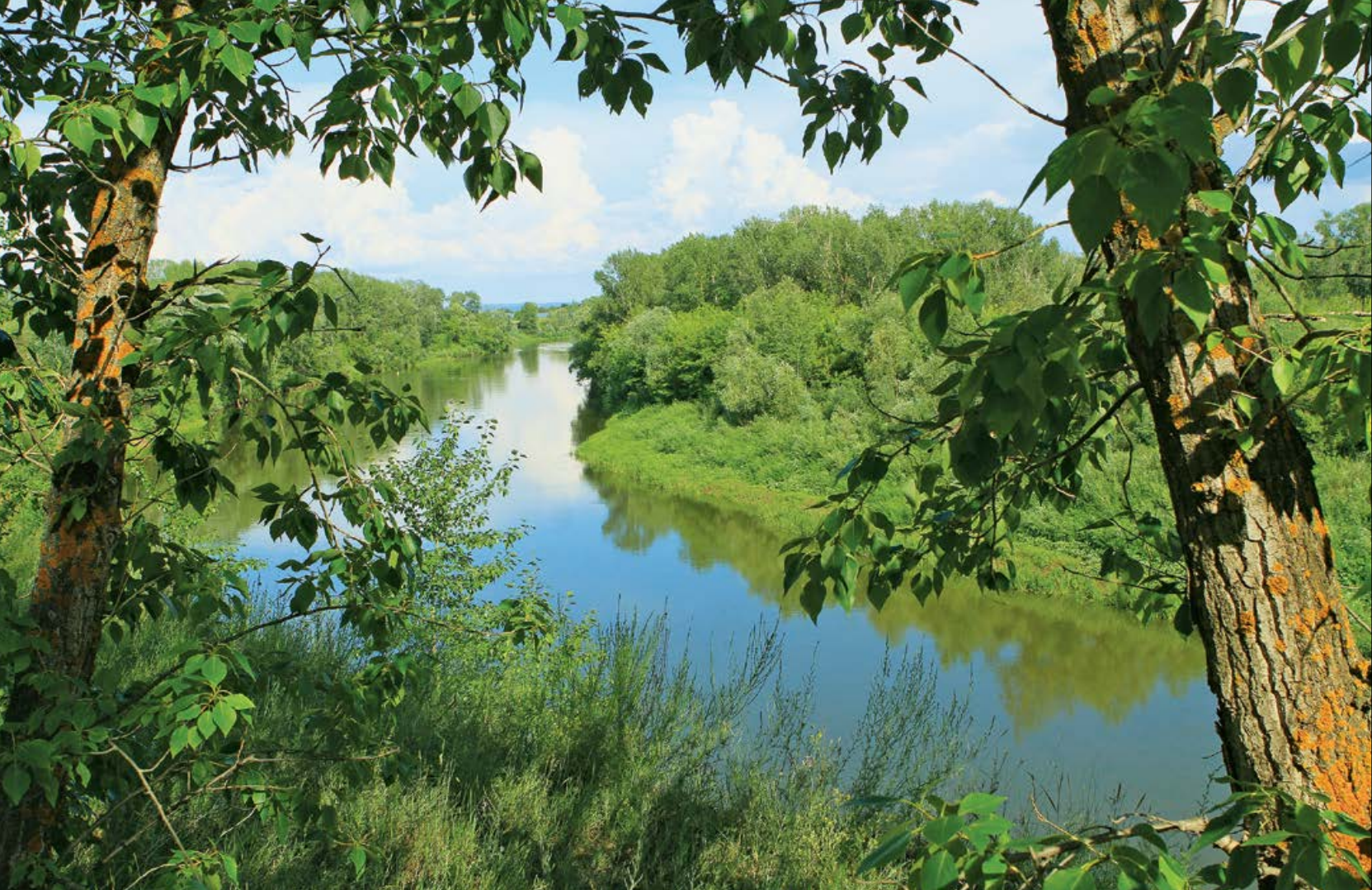
Река Самара вблизи посёлка Михайловский (сельское поселение Бобровка)