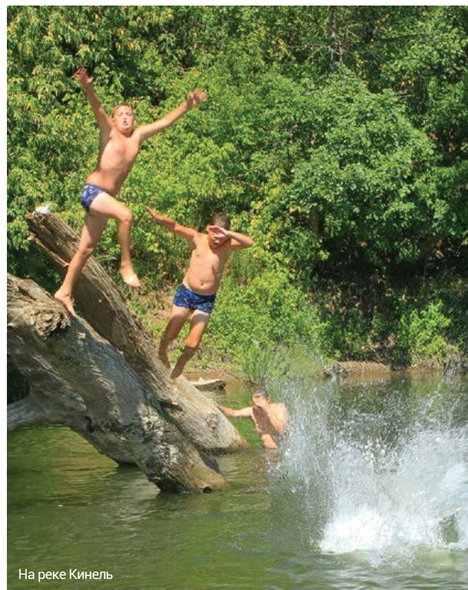
На реке Кинель

Красивое презентационное издание, направленное на развитие внутреннего туризма, рассказывает обо всех достопримечательностях и красотах Кинельского района. О некоторых из них – в нашем сегодняшнем фотоматериале, предоставленном Людмилой Мельниченко.