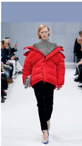
Balenciaga 2016 ready-to-wear

Напрочь забываем о коротких юбках, отсутствии шапок на голове и прочих попытках остаться в тренде холодной зимой. Объёмность, многослойность и игра фактур должны стать главными помощниками этого сезона.