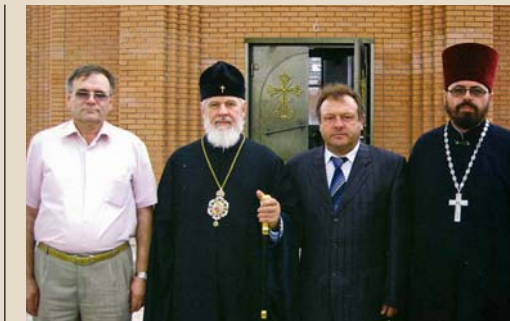
Попечительский совет на строительстве храма в селе Алтухово

С&Г Просто поражает широта вашей деятельности как депутата, общественного и мецената: от помощи малоимущим и ветеранам до строительства храмов, от поддержки молодых талантов