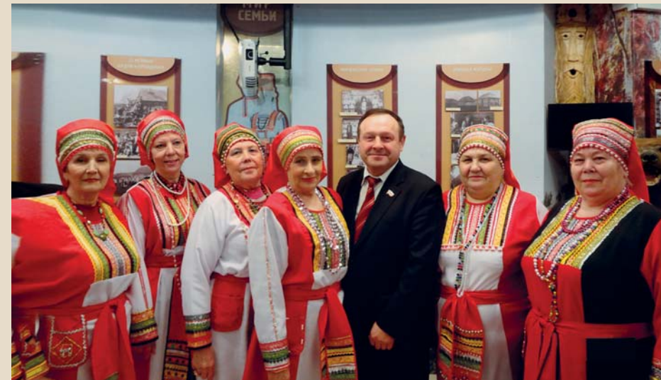
Открытие мордовского музея в Отрадном