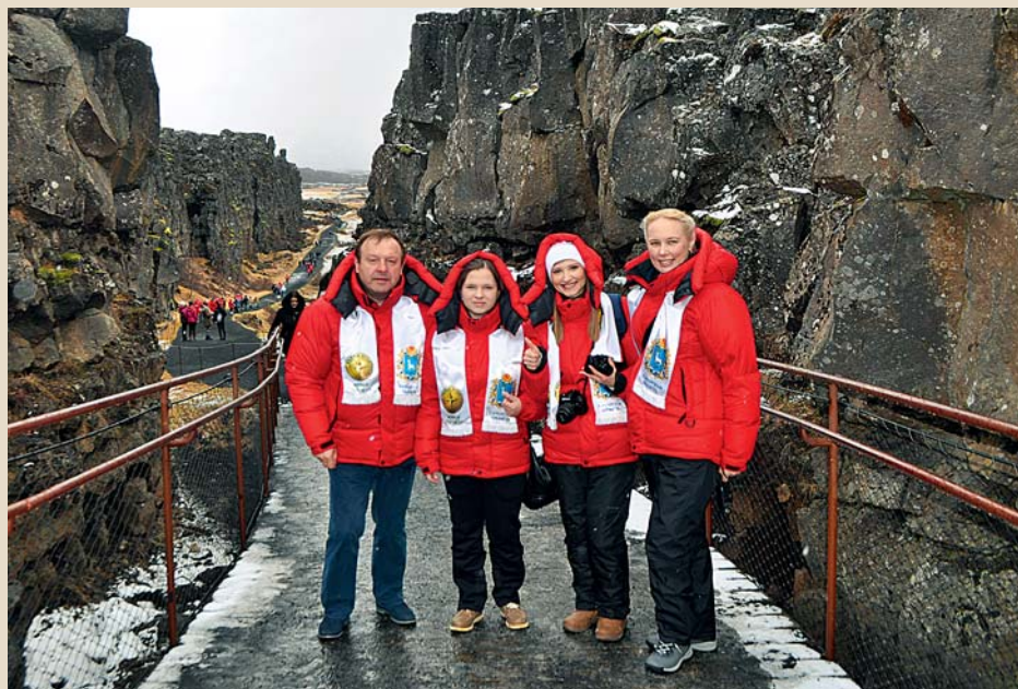
Члены делегации МЭД «Живая Планета» в Исландии

туховку. В своё время у них были квартиры в Отрадном, но со временем они обзавелись индивидуальными домами. Все живём рядом, на нашей малой родине. И такая близость к земле, к истокам, наполняет особой силой и спокойствием. Да и решать какие-то бытовые вопросы вместе гораздо легче.