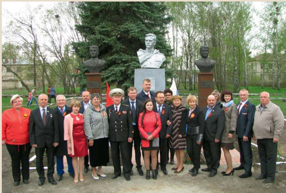
Открытие бюстов Героям Советского Союза в селе Красная Горка

который мы создали в Алтухово, стал одним из первых в районе сельских общественных советов.