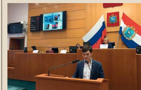
Проект «Герой нашего времени». Выступление, посвящённое В.Н. Муратову

Крупные же сёла могут и должны развиваться. Но для этого должна быть связь населения, общестественности с местной властью, администрациями. Сегодня власть приближается к народу, стремится работать на его интересы, и это радует. Однако, несмотря на все позитивные процессы, двигаться в этом направлении надо ещё активнее. Система пока не работает так, как должна работать. Не все чиновники на местах руководствуются интересами жителей. Именно поэтому люди стали объединяться в общественные организации, которые задают властям острые вопросы, выдвигают инициативы. Кстати, общественный совет,