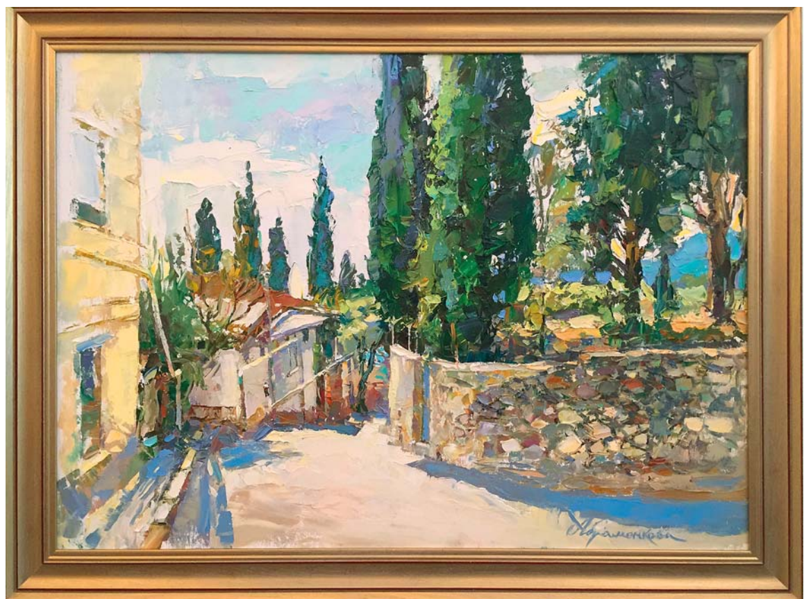
• «На улочке Гурзуфа», холст, масло, 2016 год