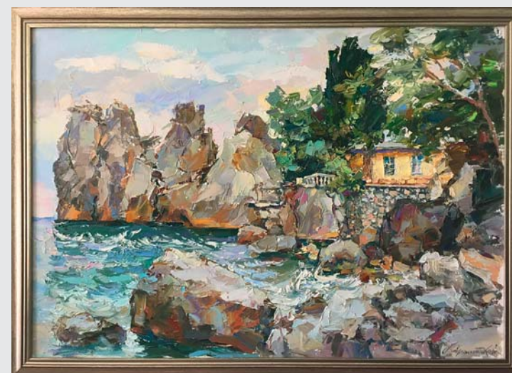
• «Гурзуф. Дача Чехова», холст, масло, 2016 год