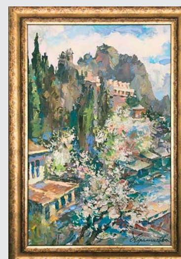
• «Крымская весна», холст, масло, 2016 год