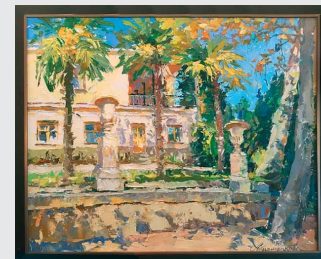
• «Музей им. Пушкина в Гурзуфе», холст, масло, 2016 год